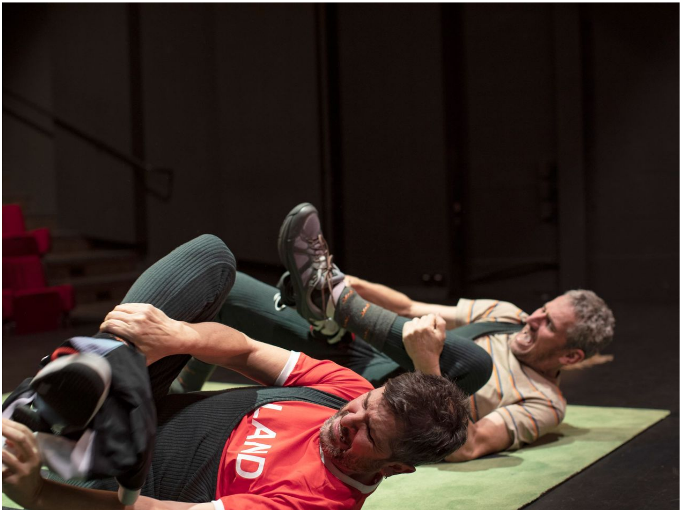
Un extrait du spectacle "Makers".

Ils ont inventé un nouveau personnage: le clown métaphysique. Au-delà du rire, de la pantalonnade, ces deux lascars nous emmènent sur les chemins en escaliers, chausse-trapes et miroirs, de la pensée philosophique. On y croise l'écrivain Borgès, on y aperçoit la physique quantique, on y goûte à l'amitié, on y mesure le temps qui passe, on y jauge nos illusions et notre capacité - ou non - de prendre notre destin en main. Avec au passage une ambition nécessaire et somme toute pas si démesurée: changer le monde.